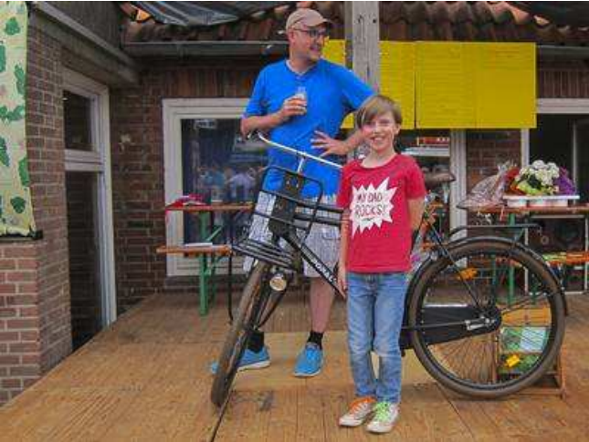
Die glücklichen Gewinner des Fahrrades