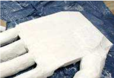
Entscheidend ist oft die Zeit und der Standpunkt ...