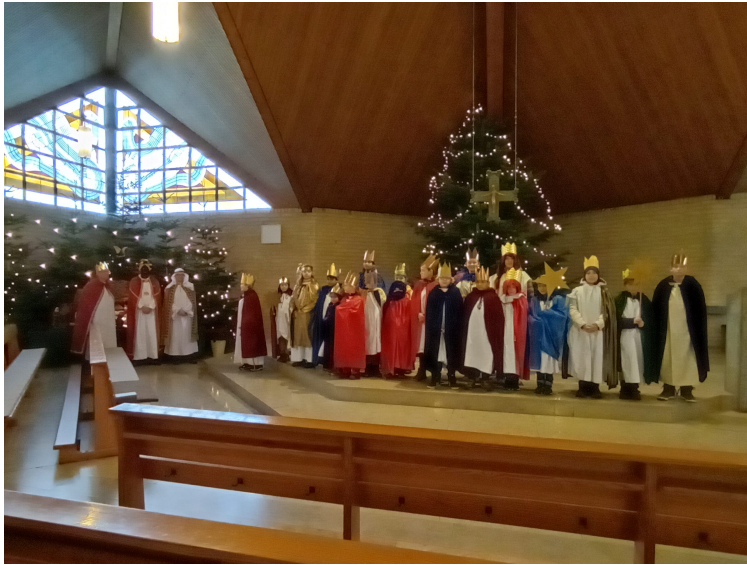
Aussendung der Sternsinger in St. Marien Sprakel