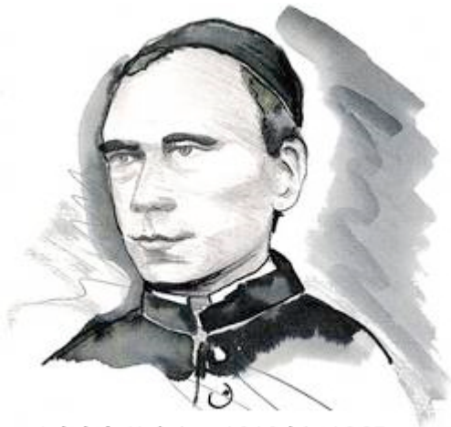
Adolph Kolping 1813 bis 1865

Die Kolpingsfamilie Münster-Kinderhaus ist Teil des Kolpingwerkes Deutschland. Die Kolpingsfamilie ist ein soziales Netzwerk, das gekennzeichnet ist von der Fürsorge und der Verantwortung der Mitglieder füreinander. Wir verstehen uns als Weg-, Glaubens-, Bildungs- und Aktionsgemeinschaft.